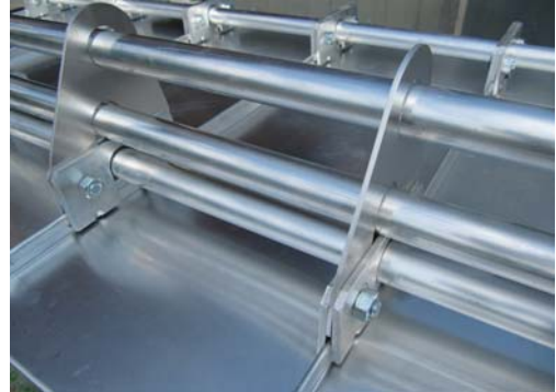
Schneefanglasche mit Aufstockelement für 2 bzw. 3 Rohre Alu 3 mm für Rohrdurchmesser 32 mm