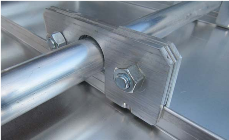
Alu Schneefanglasche für Doppelstehfalz für Rohrdurchmesser 32 mm